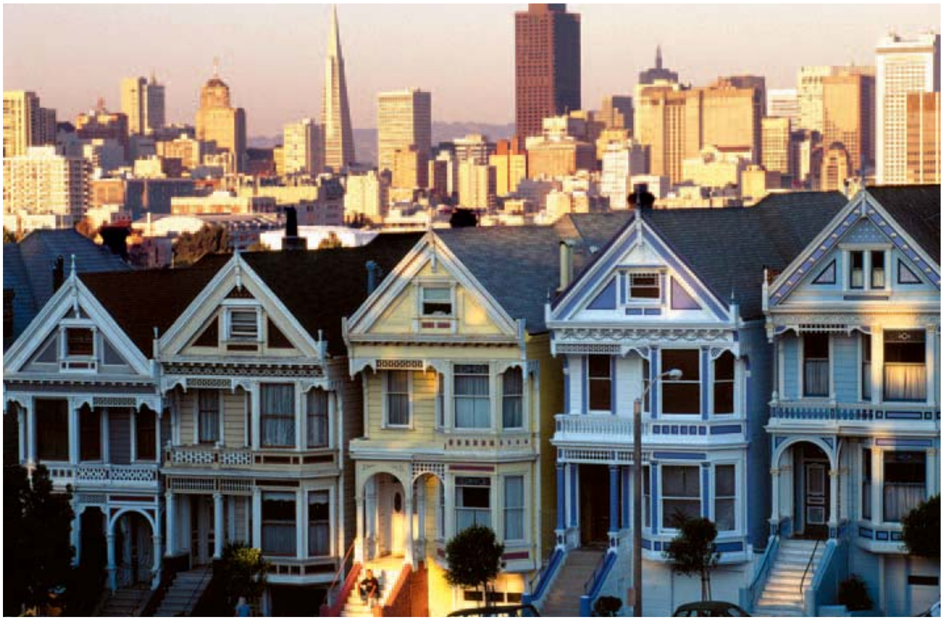
De skyline van San Francisco met op de voorgrond oude gekleurde huizen in de Victoriaanse bouwstijl die je in deze stad nog veel ziet