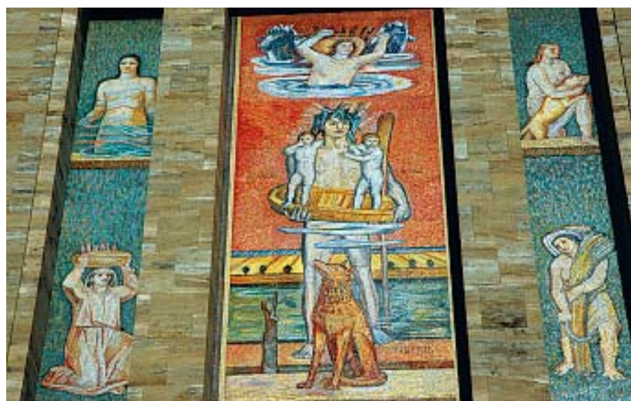
Fascistische symboliek op de Piazza Augusto Imperatore Linksonder Volksdichter Giuseppe Gioacchino Belli linksboven de poort op de Piazza del Popolo waar Christina van Zweden de stad binnenkwam

FOTO'S: CHRISTINA BOLZANI, UIT HET BOEK VAN ANDREA VREEDE